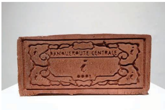
Marie Aerts, Aile du désir , 2014, série de 10 briques gravées, 22x10x5 cm.