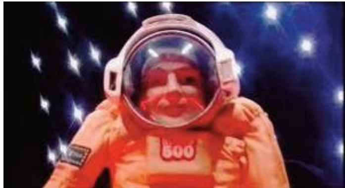
Bertrand Dezoteux, En attendant Mars , vidéo, 2017.