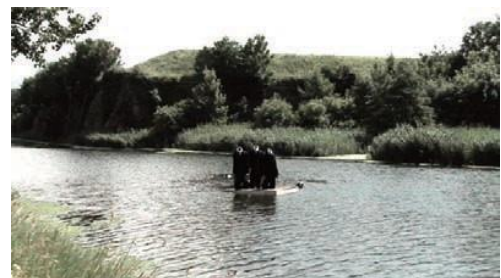
Marie Aerts, Grâce , 2013, vidéo HD, 4'40.

Le travail de Marie Aerts questionne les notions de pouvoir et d'organisation sociale qui régissent les sociétés humaines. Elle interroge les méthodes de légitimations d'un pouvoir, ou d'une forme de domination et les rapports que celles-ci entretiennent avec la croyance. Elle explore les interstices d'un pouvoir, là où les symboles s'installent et déploient leur capacité de fascination. À travers diverses stratégies d'altération, Marie Aerts s'attaque à ces concentrés de représentations, à l'aide d'opérations de soustraction et de transformation qui lui sont chères.