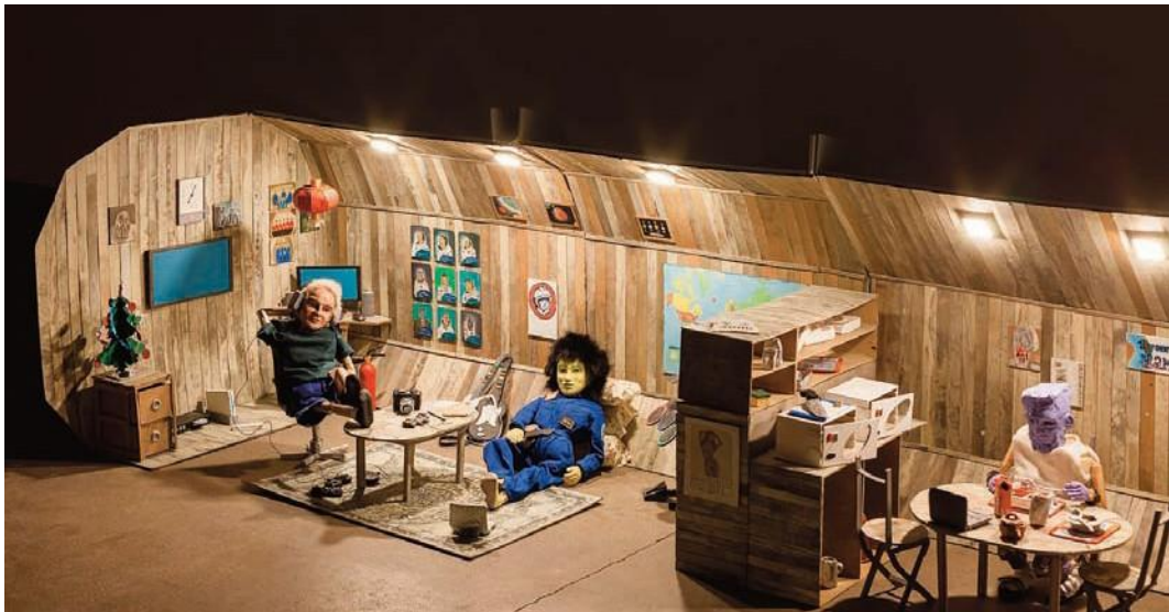
Bertrand Dezoteux, En attendant Mars , vidéo, 2017. Projet réalisé avec le soutien du programme Audi talents awards et de l'Observatoire de l'espace du CNES.

Il se forme notamment au Fresnoy – Studio national des arts contemporains (2006–2008). En février 2018, le Palais de Tokyo invite l'artiste à concevoir une œuvre pendant la saison « Discorde, fille de la nuit ». Bertrand Dezoteux transforme la façade du Palais de Tokyo en un territoire mouvant grâce à la technique du mapping vidéo. Il est actuellement en résidence à La Station, espace d'art contemporain à Nice.