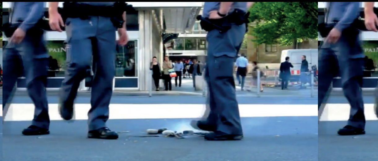
Fire, 2014 HD video, 2'48" with sound

Stefan Botez stefanbotez.tumblr.com Lien actif